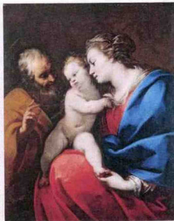
Da sinistra, Mosca, Urss (1947) di Robert Capa, al Mudec di Milano; Sacra famiglia (1640-50 c.) di Carlo Francesco Nuvolone, al Museo Bagatti Valsecchi di Milano.