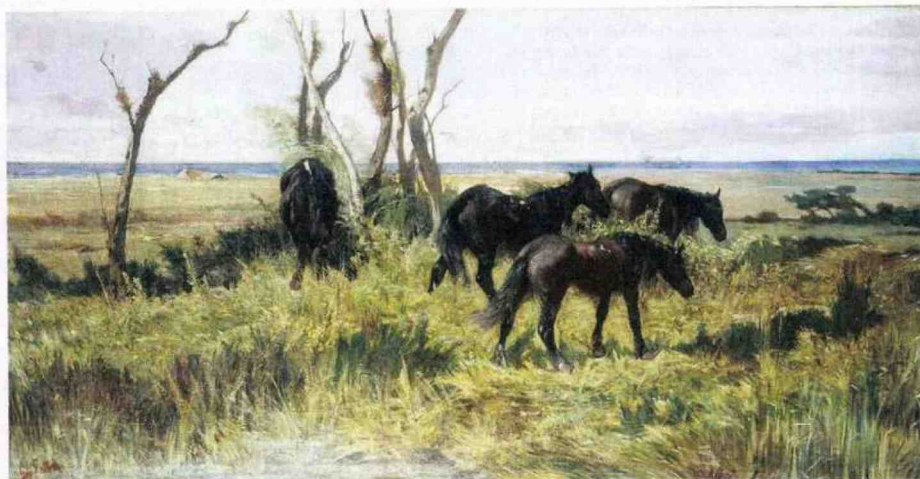
Sopra, Pastura maremmana. Cavalli al pascolo (1872) di Giovanni Fattori, in mostra a Palazzo Fava a Bologna per Fattori. L'umanità in pittura .

DAI CAPOLAVORI DI FATTORI A BOLOGNA ALLA MODERNITÀ DI GIOTTO A ROVERETO, PASSANDO PER LE ULTIME OPERE DI PICASSO ALLA FONDAZIONE BEYELER DI BASILEA → TOURINGCLUB.IT/EVENTI