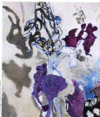
Da sinistra, La fornace ardente (1536) di Jacopo Dal Ponte, a Bassano del Grappa (Vi); Tempesta e assalto (2021) di Massimiliano Fabbrì, a Bagnacavallo (Ra).