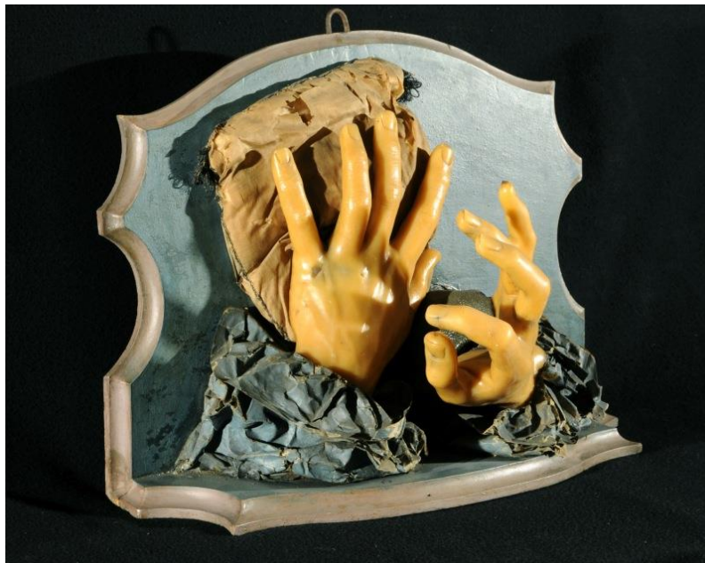
Mani sensibili, Anna Morandi Manzolini (Bologna, 1714-1774) Ceroplastica 32,5 x 41,5 x 19,8 cm 1756 ca. su gentile concessione del Museo di Palazzo Poggi – Sistema Museale di Ateneo – Alma Mater Studiorum Università di Bologna