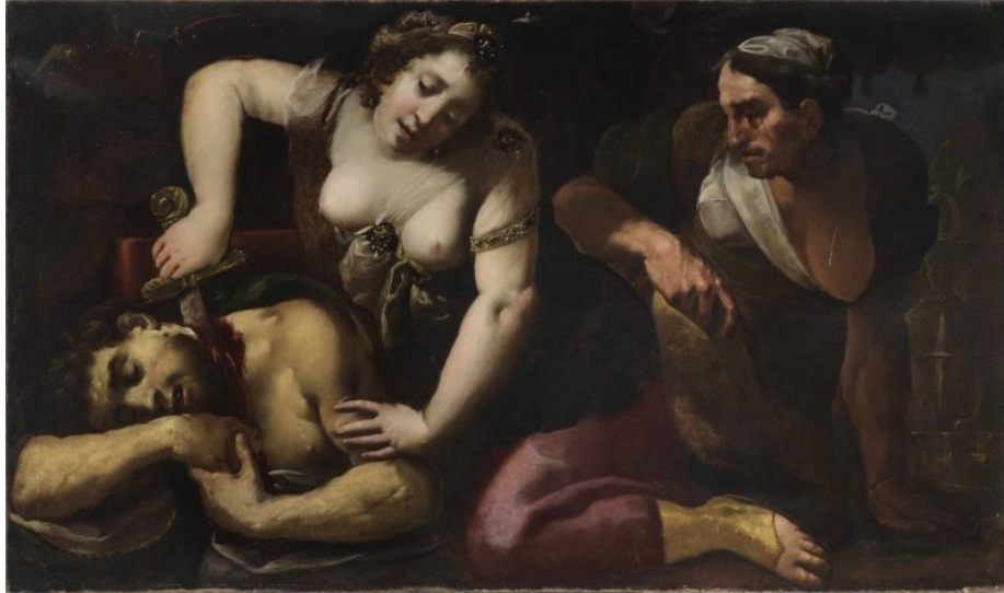
Giuditta e Oloferne, Giovan Battista Crespi, il Cerano (Romagnano Sesia 1573 – Milano 1632) Olio su tela 113 x 191 cm 1630 ca. Collezione privata