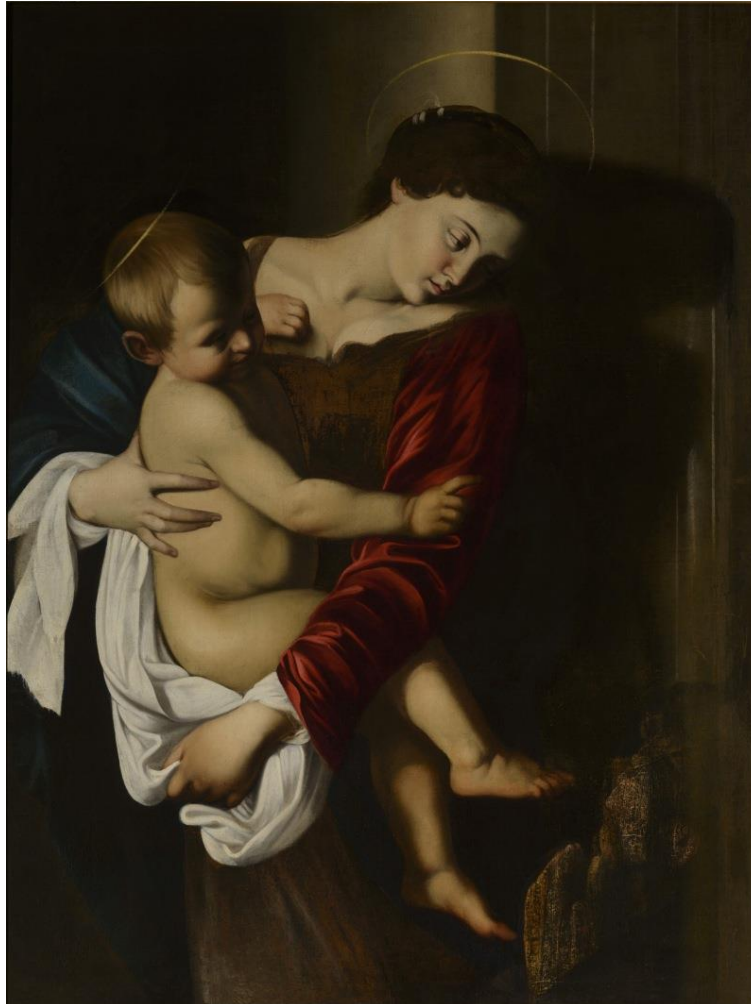
Madonna col Bambino, Caravaggio (attribuito a) (Michelangelo Merisi, Milano 1573 – Porto Ercole, 1610) Olio su tela 123 x 91cm 1605 ca. Collezione privata © Giuseppe e Luciano Malcangi – Giuditta e Oloferne, Giovan Battista Crespi, il Cerano (Romagnano Sesia 1573 – Milano 1632) Olio su tela 113 x 191 cm 1630 ca. Collezione privata © Giuseppe e Luciano Malcangi