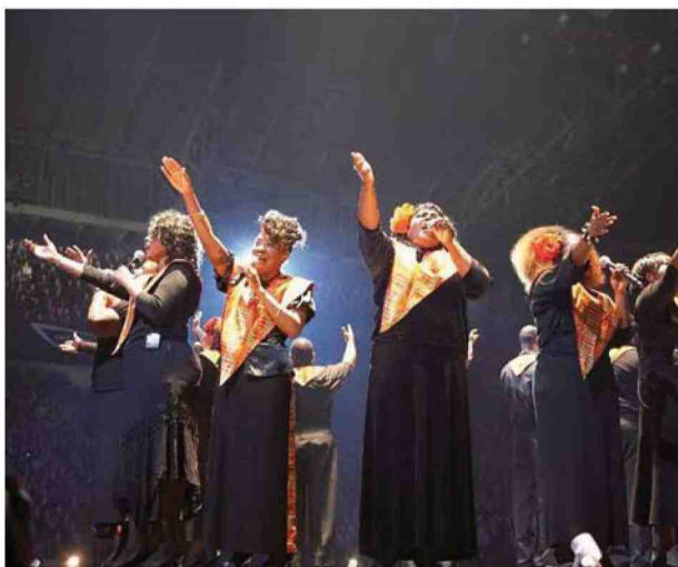
Harlem Gospel Choir