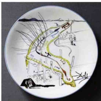
Salvador Dalí. La conquista del cosmo. Orologio molle dello Spazio-Tempo (1984)