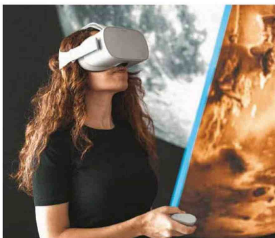
La Luna. E poi? alla Fabbrica del Vapore di Milano

nseexpoform.com | lalunaepoi.it | space-adventure.it giovediscienza.it | mostramano.it